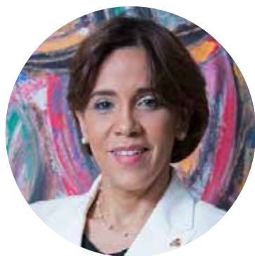
Presidente Mercedes Canalda de Beras-Goico (Banco ADOPEM)

Desde 1985 al 1993 laboró en el Banco Central de la República Dominicana en diferentes áreas de asuntos económicos y departamento internacional.